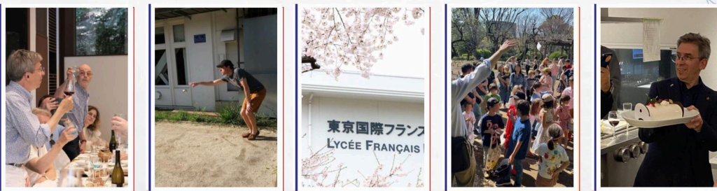
CONCOURS DE PÉTANQUE, PIC-NIC, PÂQUES