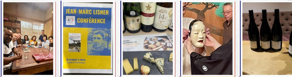
DÉGUSTATIONS & CONFÉRENCES