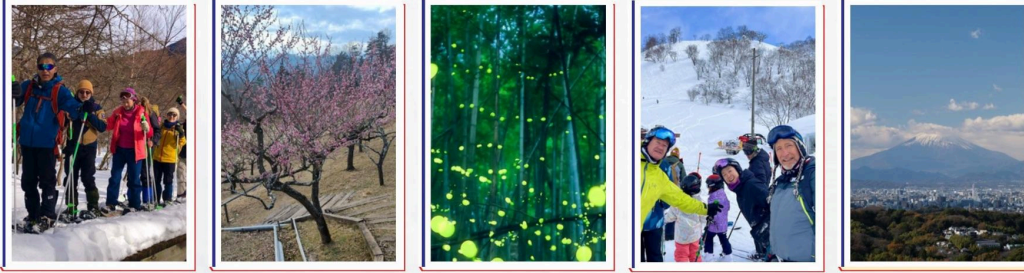
BALADES CULTURELLES ET RANDONNÉES/ EXCURSIONS